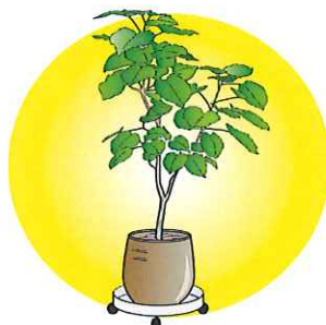
大きい観葉植物を移動させるのに、キャスター付きの鉢受けを使うと便利です。

土で育てている植物に、優しい光を当てることで、元気に育つ手助けになります。また、部屋に入ったときに真っ先に目が行く場所でもあるので、